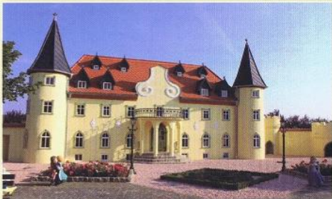
Unser Schloss der Märchen wurde im Sommer 2014 eingeweiht